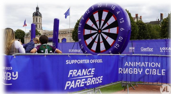
Parrainage de l'animation sportive