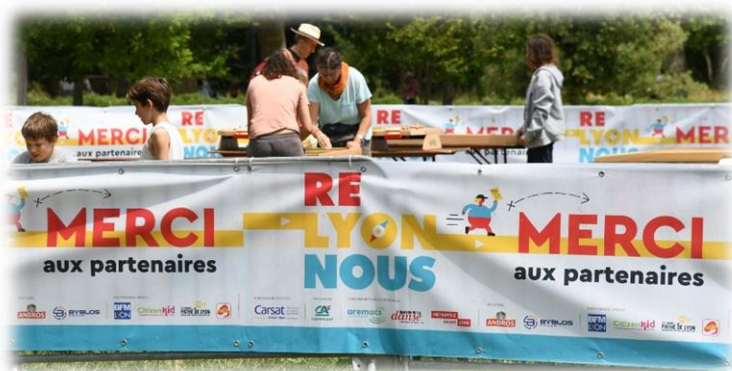
Banderoles d'arrivée et de départ