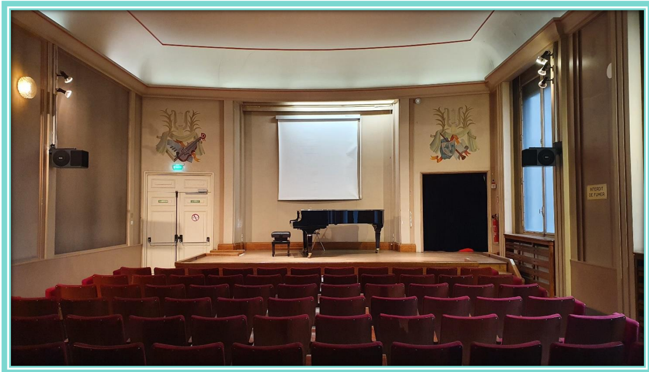
Piano : Ibach Richard Strauss