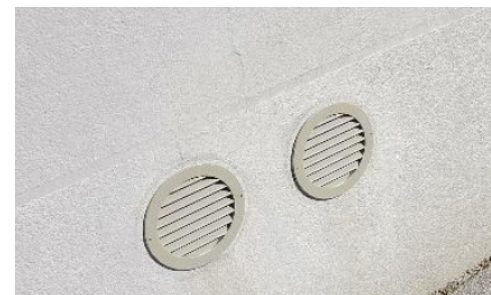
↑ Exemple de bouches d'aération d'un climatiseur intérieur