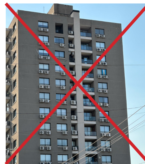
↑ L'installation d'un bloc de climatisation en façade d'un immeuble doit être intégrée à la construction sans émergence en façade.

→ Sous réserve du respect du décret n°2010-349 du 31 mars 2010 et de l'arrêté du 16 avril 2010 relatifs à l'inspection des systèmes de climatisation et des pompes à chaleur réversibles dont la puissance frigorifique est supérieure à 12 kW et de l'Arrêté du 24 juillet 2020 relatif à l'inspection périodique des systèmes thermodynamiques et des systèmes de ventilation combiné à un chauffage dont la puissance nominale utile est supérieure à 70 kilowatts