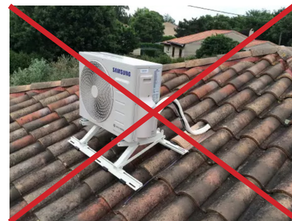
↑ L'installation d'un bloc de climatisation en toiture d'un immeuble doit être intégrée qualitativement