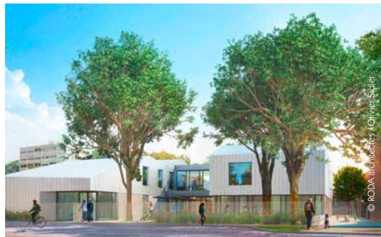
© RODA architectes / Olivier Sidler

La Ville de Lyon vient donc de lancer la construction d'un nouveau bâtiment au 147 avenue Général-Frère. Il s'inscrit dans le projet de renouvellement urbain du quartier qui prévoit le réaménagement de 16 000 m 2 d'espaces publics, de nouveaux commerces ainsi que la requalification et la diversification des logements.