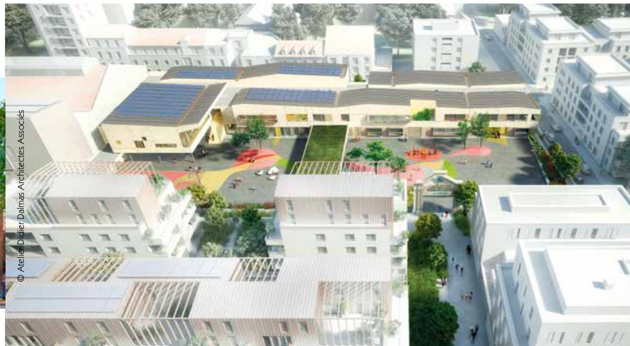
© Atelier Didier Dalmas Architectes Associés

à diverses activités, les écoliers bénéficieront de tout le confort moderne et des meilleures conditions possibles pour travailler. Le bâtiment répondra aux critères du label BEPOS Effinergie +, ce qui signifie qu'il produira davantage d'énergie qu'il n'en consommera.