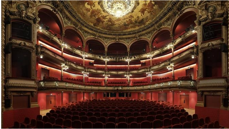
Le théâtre des Célestins