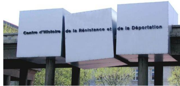
Le CHR D